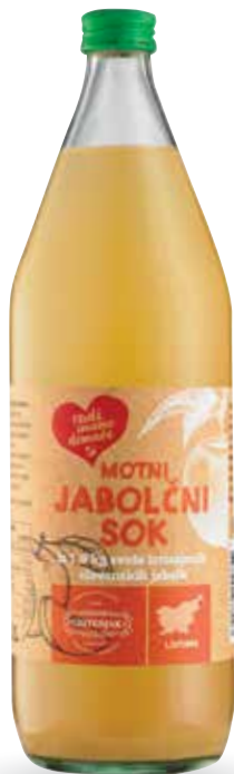
JABOLČNI SOK RADI IMAMO DOMAČE motni, iz 1,6 kg sveže iztisnjenih slovenskih jabolk, 1 l, Trstenjak