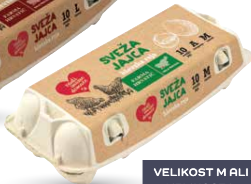
JAJCA RADI IMAMO DOMAČE hlevska reja, 10/1, Farma Hrvatič