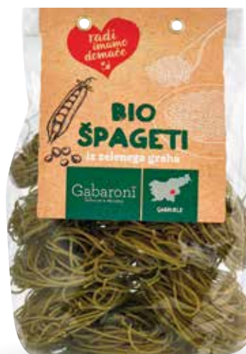
ŠPAGETI IZ ZELENEGA GRAHA RADI IMAMO DOMAČE ekološki, 400 g, Gabaroni