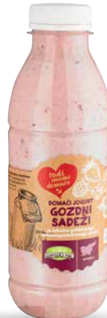
DOMAČI SADNI JOGURT RADI IMAMO DOMAČE 500 g, Gorički raj