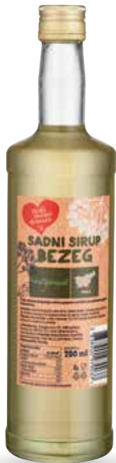
SADNI SIRUP BEZEG RADI IMAMO DOMAČE 700 ml, Domačija Brozovič