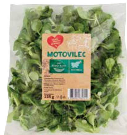
MOTOVILEC RADI IMAMO DOMAČE 125 g, Kumer