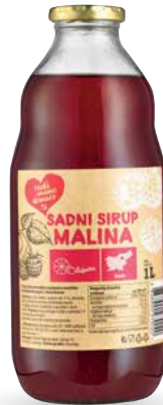
SADNI SIRUP MALINA RADI IMAMO DOMAČE 1 l, Podpečan