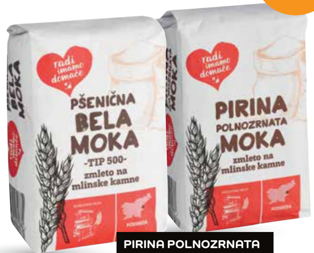
PIRINA POLNOZRNATA ALI PŠENIČNA BELA