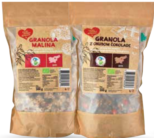
Z OKUSOM ČOKOLADE ALI Z OKUSOM MALINE