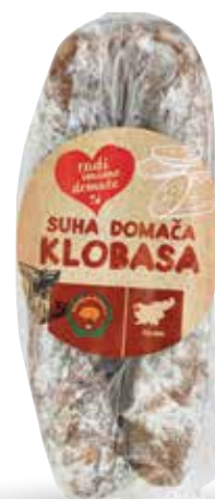
SUHA DOMAČA KLOBASA RADI IMAMO DOMAČE pakirana, 280 g, Mesarija Kragelj