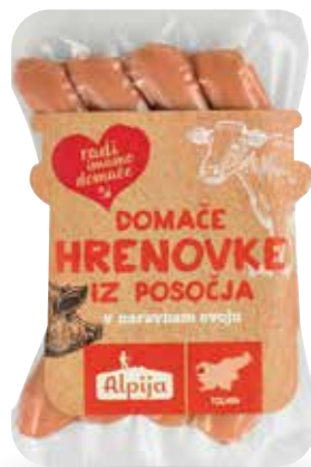
DOMAČE HRENOVKE RADI IMAMO DOMAČE iz Posočja, v naravnem ovoju, pakirane, cca. 290 g, Alpija