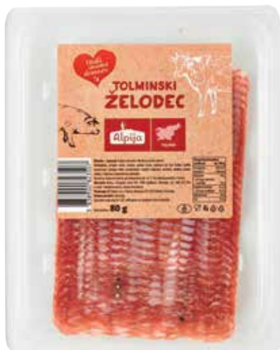
NAREZEK TOLMINSKI ŽELODEC RADI IMAMO DOMAČE pakiran, 80 g, Alpija