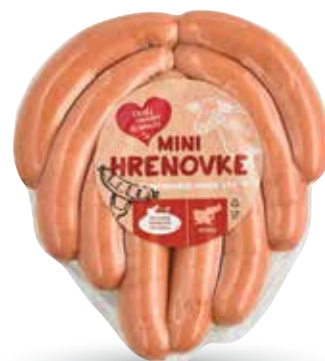
MINI HRENOVKE RADI IMAMO DOMAČE v naravnem ovoju, pakirane, cca. 350 g, Grajske mesnine Sevnica