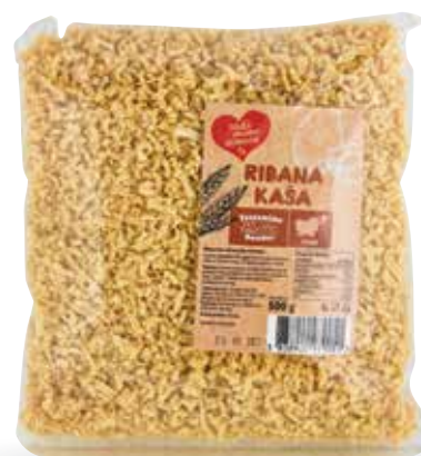
RIBANA KAŠA RADI IMAMO DOMAČE 500 g, Testenine Bandur