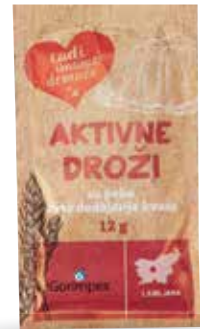
SUHE AKTIVNE DROŽI RADI IMAMO DOMAČE 12 g, Gorimpex