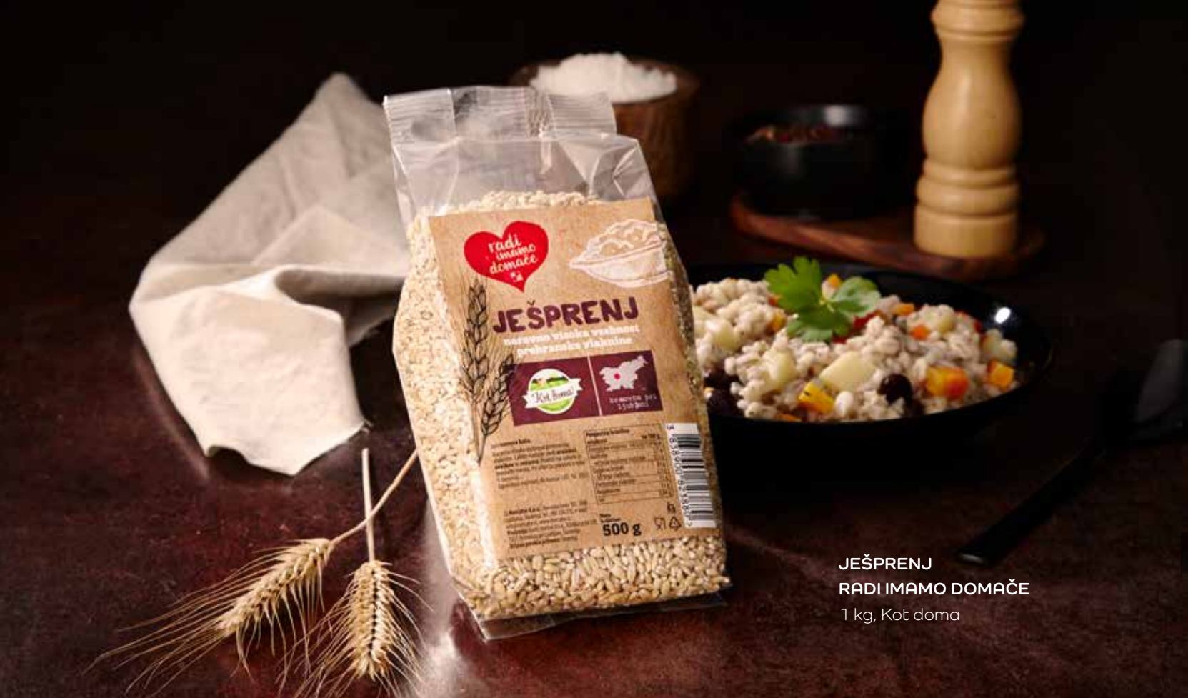
JEŠPRENJ RADI IMAMO DOMAČE 1 kg, Kot doma