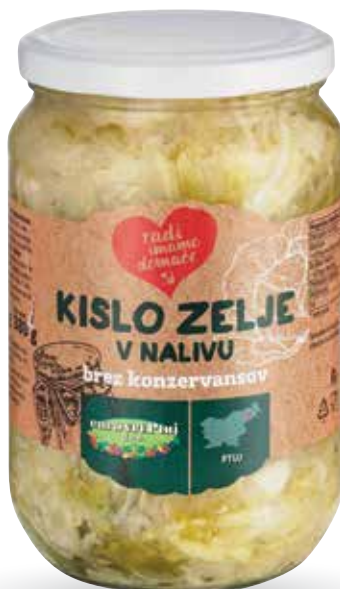
KISLO ZELJE RADI IMAMO DOMAČE v nalivu, brez konzervansov, 660 g, Euro vrt Ptuj