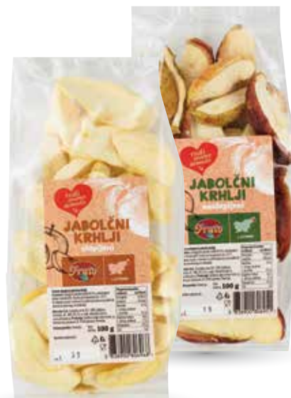
JABOLČNI KRHLJI RADI IMAMO DOMAČE olupljeni ali neolupljeni, 100 g, Leštan Iztok