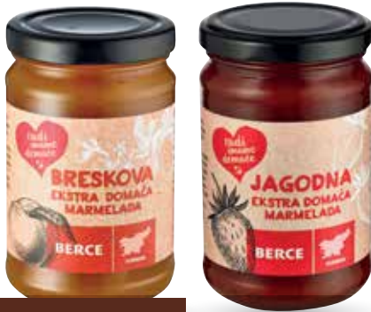
BRESKOVA ALI JAGODNA