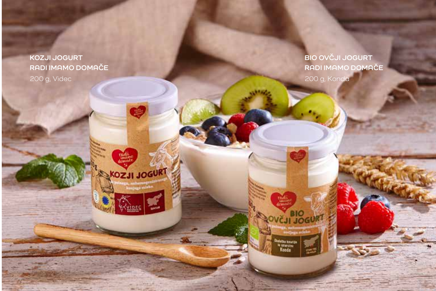
BIO OVČJI JOGURT RADI IMAMO DOMAČE 200 g, Konda