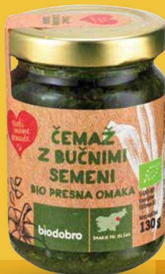
BIO ČEMAŽEVA OMAKA RADI IMAMO DOMAČE čemaž z bučnimi semeni, 130 g, presna, Biodobro