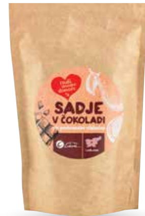
SADJE V ČOKOLADI RADI IMAMO DOMAČE 150 g, Cukrček