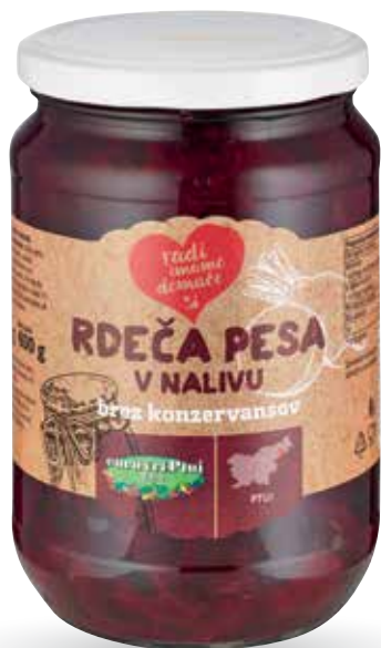
RDEČA PESA RADI IMAMO DOMAČE v nalivu, brez konzervansov, 690 g, Euro vrt Ptuj