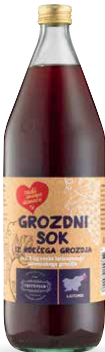
GROZDNI SOK RADI IMAMO DOMAČE iz 1,5 kg sveže iztisnjenih slovenskega grozdja, 1 l, Trstenjak