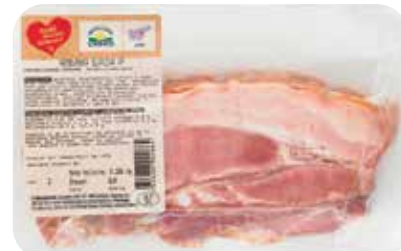
HAMBUŠKA SLANINA RADI IMAMO DOMAČE pakirana, cca. 250 g, KZ Laško