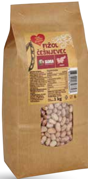
FIZOL ČEŠNJEVEC RADI IMAMO DOMAČE 1 kg, Sloga