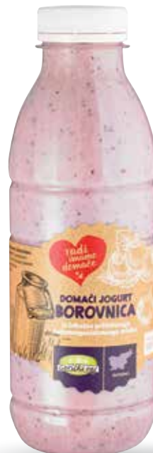
GOZDNI SADEŽI BOROVNICA