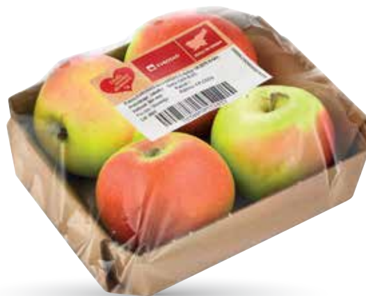
JABOLKA RADI IMAMO DOMAČE različne sorte