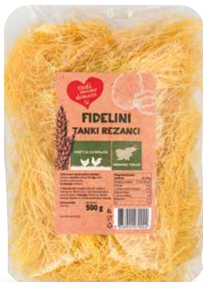
FIDELINI RADI IMAMO DOMAČE tanki rezanci, 500 g, Kmetija Ovsenjak