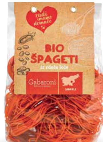
ŠPAGETI IZ RDEČE LEČE RADI IMAMO DOMAČE ekološki, 400 g, Gabaroni