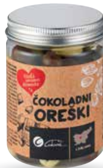
ČOKOLADNI OREŠKI RADI IMAMO DOMAČE mix, 150 g, Cukrček