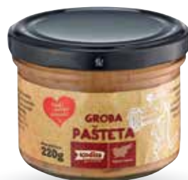
PAŠTETA RADI IMAMO DOMAČE groba, pakirana, 220 g, Kodila