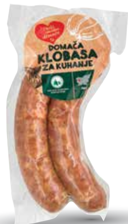
DOMAČA KLOBASA ZA KUHANJE RADI IMAMO DOMAČE pakirana, cca. 250 g, KGZ Idrija