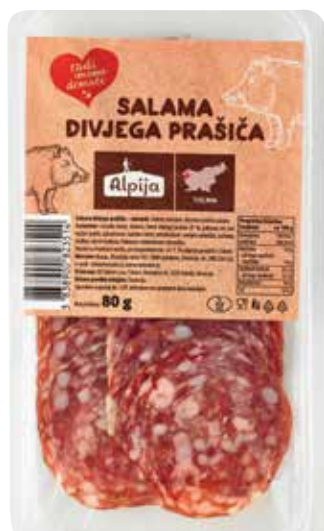
NAREZEK SALAMA DIVJEGA PRAŠIČA RADI IMAMO DOMAČE pakiran, 80 g, Alpija