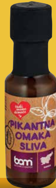
OMAKA PIKANT JURKA ALI SLIVA RADI IMAMO DOMAČE 100 ml, Bam