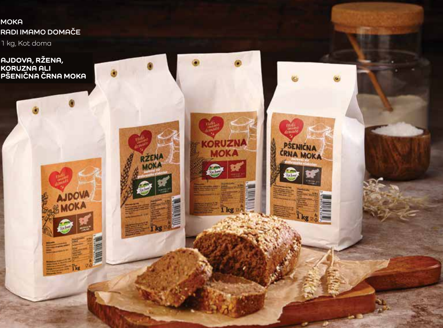
AJDOVA, RŽENA, KORUZNA ALI PŠENIČNA ČRNA MOKA