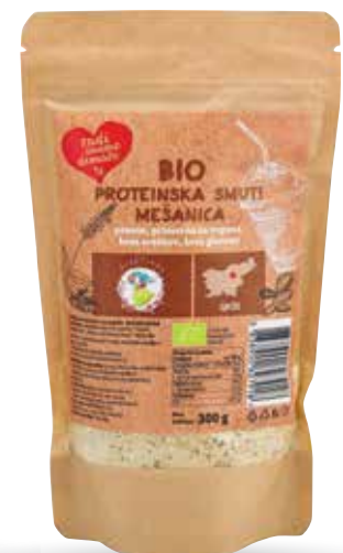
PROTEINSKA SMUTI MEŠANICA, BIO RADI IMAMO DOMAČE 300 g, DrobTinka