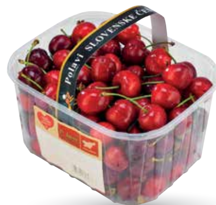
ČEŠNJE RADI IMAMO DOMAČE cena za kg