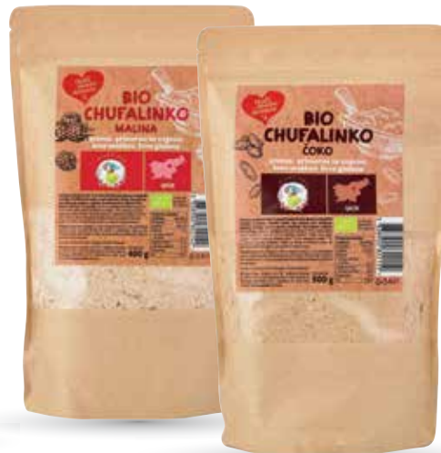
Z OKUSOM MALINE ALI Z OKUSOM ČOKOLADE