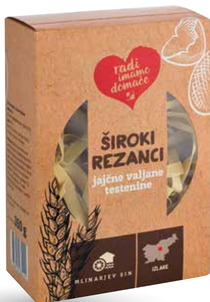
ŠIROKI REZANCI RADI IMAMO DOMAČE valjani jajčni, 350 g, Mlinarjev sin