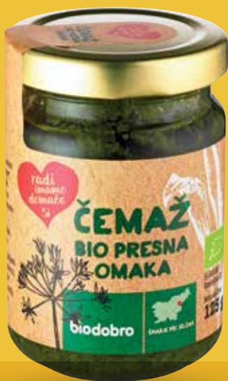
BIO ČEMAŽEVA OMAKA RADI IMAMO DOMAČE presna, 125 g, Biodobro

v trakcijah, v slanem naliivu, 350 g, Euro vrt