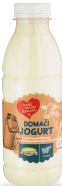
DOMAČI JOGURT RADI IMAMO DOMAČE iz lokalno pridelanega nehomogeniziranega mleka, 500 g, Gorički raj