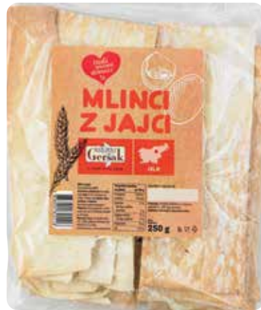
MLINCI RADI IMAMO DOMAČE 250 g, Geršak