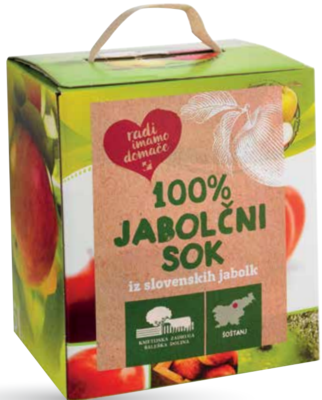
JABOLČNI SOK RADI IMAMO DOMAČE 100 %, 5 l, KZ Šaleška dolina