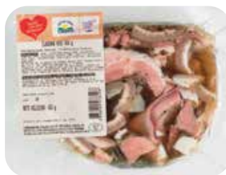
TLAČENKA RADI IMAMO DOMAČE mini, pakirana, 450 g, KZ Laško