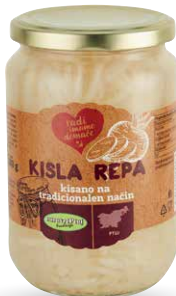
KISLA REPA RADI IMAMO DOMAČE v nalivu, brez konzervansov, 660 g, Euro vrt Ptuj