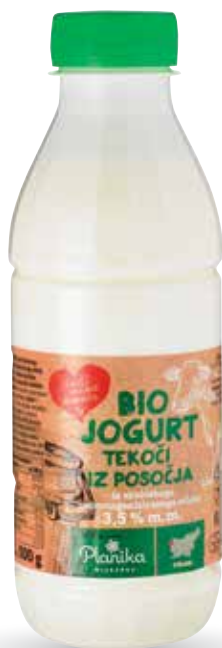
BIO JOGURT RADI IMAMO DOMAČE tekoči, iz Posočja, iz nehomogeniziranega mleka, 3,5 % m. m., 500 g, Mlekarna Planika