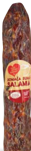
SUHA DOMAČA SALAMA RADI IMAMO DOMAČE pakirana, 280 g, Mesnine Bohinja