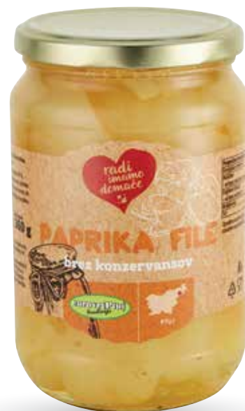
PAPRIKA FILE RADI IMAMO DOMAČE v nalivu, brez konzervansov, 660 g, Euro vrt Ptuj