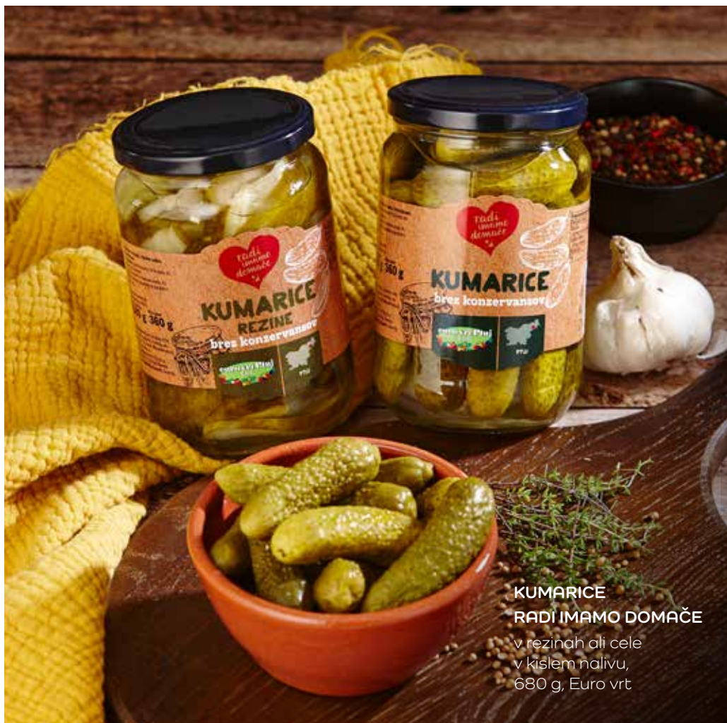
KUMARICE RADI IMAMO DOMAČE v rezinah ali cele v kislem nalivu, 680 g, Euro vrt