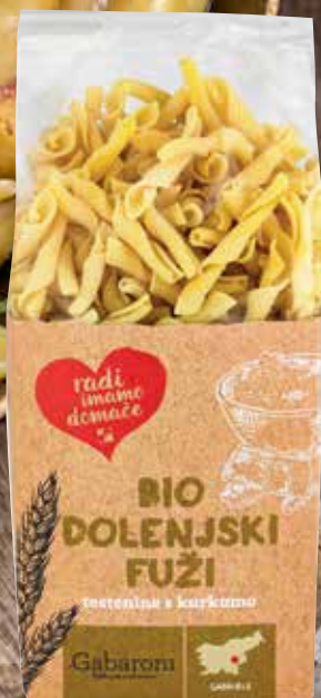
DOLENJSKI FUŽI RADI IMAMO DOMAČE ekološki, 400 g, Gabaroni