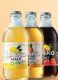
Laško Malt ananas, dark limona šipek, 0,33l T.P.: 20 kos ŠIFRA art.: 117422, 117417