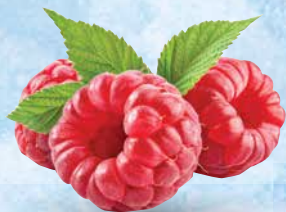
Maline Garden Good 400 g • T.P.: 20 kos • ŠIFRA art.: 107531 • Cena: 3,4163 • Cena z DDV: 3,74