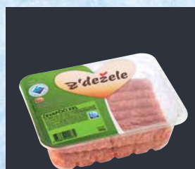
Čevapčiči Z'dežele, 960 g T.P.: 1 kos ŠIFRA art.: 319740