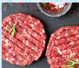
Pleskavica mešana 960 g T.P.: 1 kos ŠIFRA art.: 343911