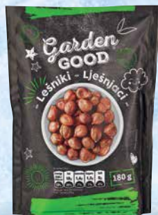
Lešniki Garden Good jedrca, 180 g • T.P.: 12 kos • ŠIFRA art.: 875755 • Cena: 3,4632 • Cena z DDV: 3,79