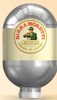
Pivo Birra Moretti Blade 8 l T.P.: 1 kos ŠIFRA art.: 678557