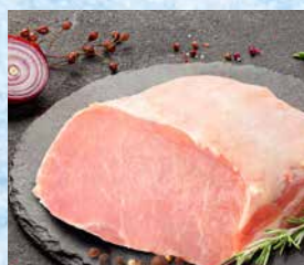
Svinjski laks kare brez kosti T.P.: 1 kg ŠIFRA art.: 725709