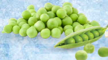
Grah Garden Good 1 kg • T.P.: 10 kos • ŠIFRA art.: 119114 • Cena: 1,6110 • Cena z DDV: 1,76