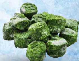
Pasirana špinacha Flanders, briketi, 2,5 kg T.P.: X kos • ŠIFRA art.: 161211 Cena: 3,3905 • Cena z DDV: 3,71 Cena za kg: 1,3562