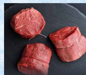
Pljučna pečenka mlada govedina, brez kosti, pakirana, cena za kg T.P.: 1 kg ŠIFRA art.: 343859