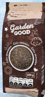
Chia semena Garden Good 200 g • T.P.: 14 Kos • ŠIFRA art.: 849369 • Cena: 1,8063 • Cena z DDV: 1,98