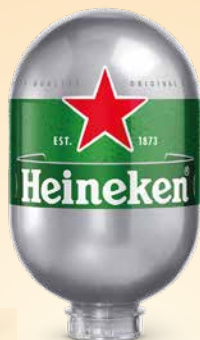
Pivo Heineken Blade , 8 l sod T.P.: 1 kos ŠIFRA art.: 548810