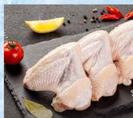
Piščančja krila 2 delna, Gastro, pakirana, cena za kg T.P.: 1 kg ŠIFRA art.: 632965