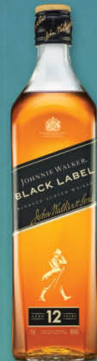
Whisky Johnnie Walker Black Label, 0,7 l T.P.: 12 kos ŠIFRA art.: 587606