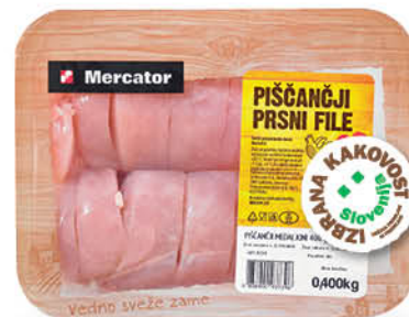
Piščančji medaljoni Mercator, Izbrana kakovost, pakirani, 400 g ŠIFRA art.: 237475