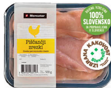
Piščančji zrezki Mercator, izbrana kakovost, pakirani, 500 g ŠIFRA art.: 135992