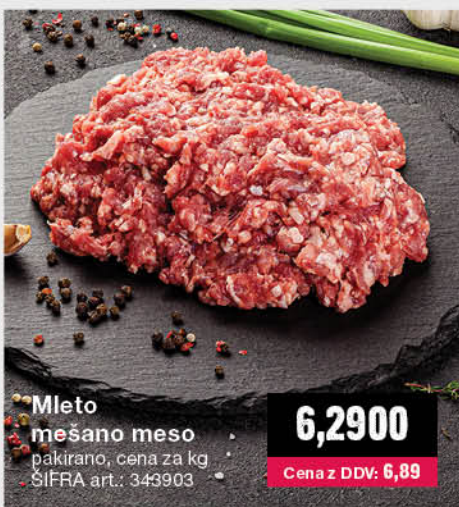
Mleto mesano meso pakirano, cena za kg ŠIFRA art.: 343903