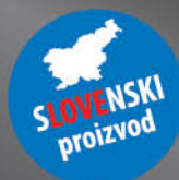
Mleko Bar Latte 3,8% m.m., 1 l T.P.: 12 kos ŠIFRA art.: 765476

SPECIALIZIRANO TRAJNO MLEKO ZA GOSTINSTVO