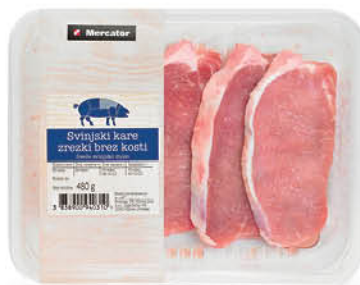
Svinjski kare brez kosti, zrezki, Mercator, 480 g ŠIFRA art.: 129739