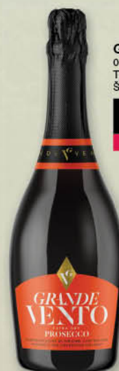
Grande Vento 0,75 l T.P.: 6 kos ŠIFRA art.: 086734