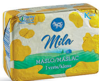
Maslo Mila 250 g T.P.: 40 kos ŠIFRA art.: 026285