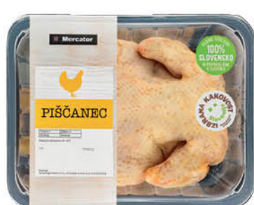
Piščanec Mercator, kontrolirana atmosfera, Izbrana kakovost, pakiran, cena za kg ŠIFRA art.: 530015