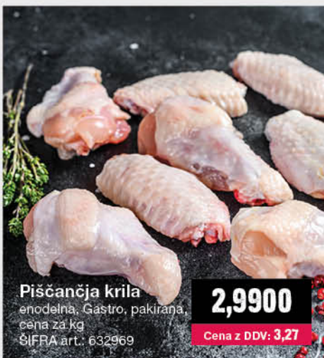
Piščančja krila enodelna, Gastro, pakirana, cena za kg ŠIFRA art.: 632969