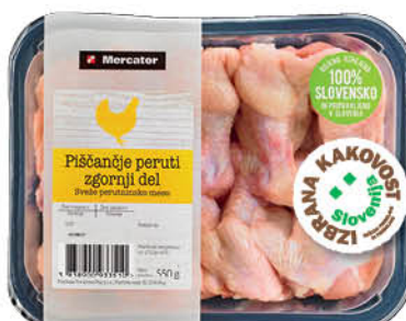
Piščančje peruti zgornji del, Mercator, Izbrana kakovost, 550 g ŠIFRA art.: 135981