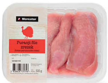
Puranji file zrezek Mercator, pakirano, 500 g ŠIFRA art.: 561943