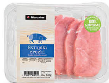
Svinjski zrezki iz stegna, Mercator, pakirani, 400 g ŠIFRA art.: 365426