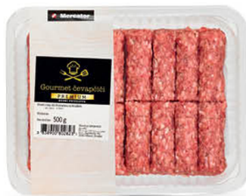
Čevapčiči Premium, Mercator, 500 g ŠIFRA art.: 730553