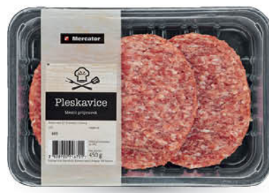
Pleskavice Mercator, pakirane, 450 g ŠIFRA art.: 601106