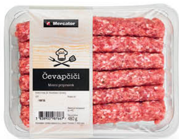
Čevapčiči Mercator, pakirani, 480 g ŠIFRA art.: 679320