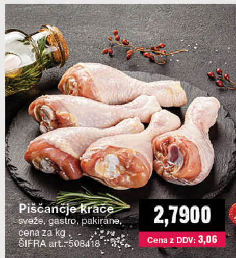
Piščančje krače sveže, gastro, pakirane, cena za kg ŠIFRA art.: 508418