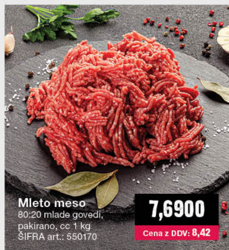
Mleto meso 80:20 mlade govdi, pakirano, cc 1 kg ŠIFRA art.: 550170