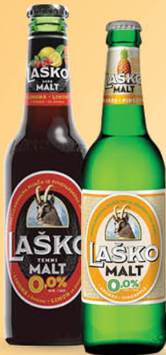
Pivo Laško Malt dark, limona šipek ali ananas, 0,33 l T.P.: 24 kos ŠIFRA art.: 767241, 615318