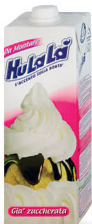
Krema rastlinska Hulalai, 1 l T.P.: 10 kos ŠIFRA art.: 129915