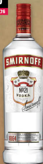
Vodka Smirnoff 1 l T.P.: 12 kos ŠIFRA art.: 724154