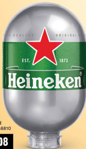
Pivo Heineken Blade, 8 l, sod ŠIFRA art.: 548810