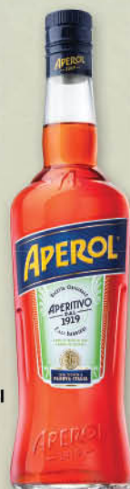
Grencica Aperol 1 l T.P.: 6 kos ŠIFRA art.: 189621