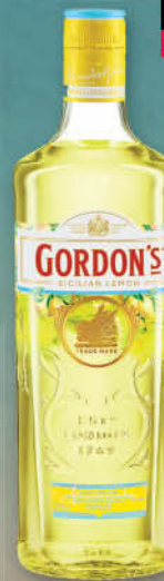
Gin Gordon's Sicilian Lemon, 0,7 l T.P.: 6 kos ŠIFRA art.: 865372