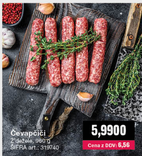
Čevapčići Z'đežela, 960 g ŠIFRA art.: 319740