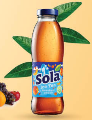
Sola ledeni čaj breskev, 0,33 l T.P.: 12 kos ŠIFRA art.: 776695