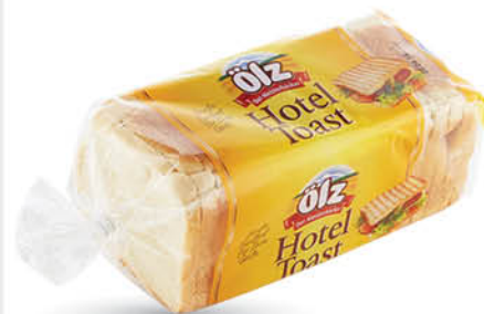
Hotel toast 750 g T.P.: 6 kos ŠIFRA art.: 549361