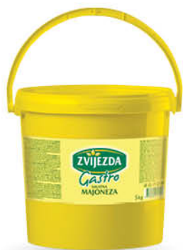
Majoneza Zvijezda Gastro, 5 kg ŠIFRA art.: 280099