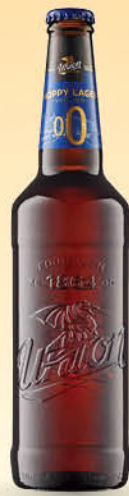
Union Premium Hoppy lager, 0,0, 0,5 l T.P.: 20 kos ŠIFRA art.: 618429