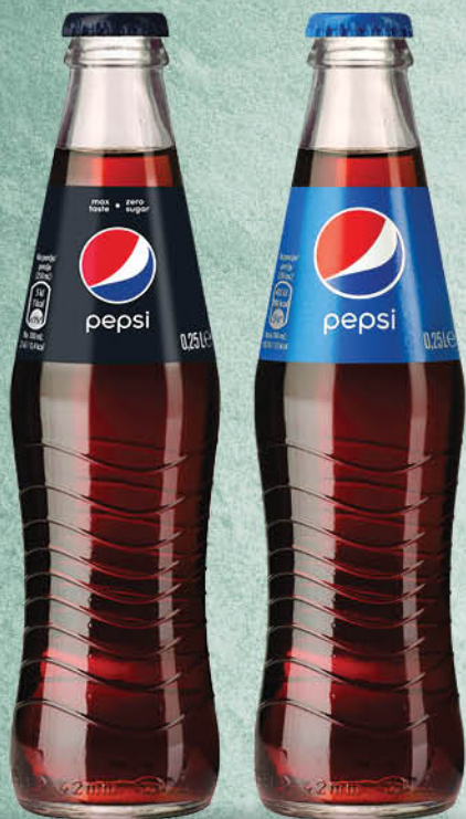
Pijača Pepsi Original ali Black, 250 ml T.P.: 24 kos ŠIFRA art.: 245938, 497005