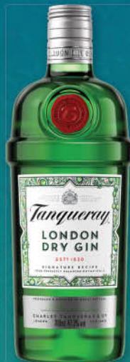
Gin Tanqueray London dry, 0,7 l T.P.: 6 kos ŠIFRA art.: 263312