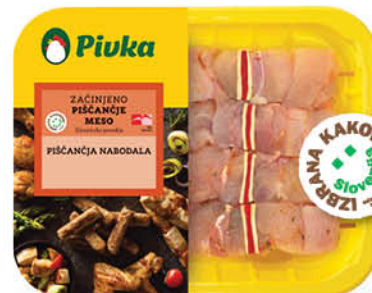
Piščančja nabodala Pivka, Izbrana kakovost, pakirana, 400 g ŠIFRA art.: 281153