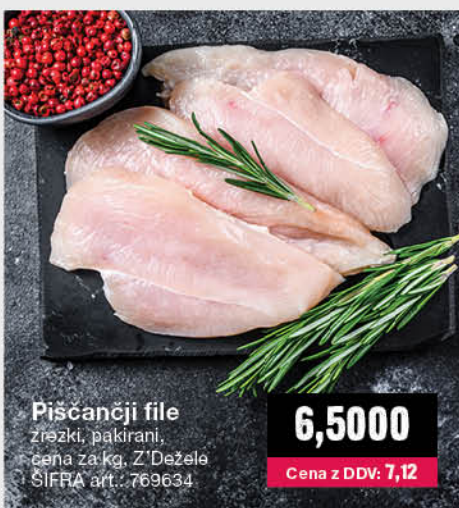
Piščančji file zrezki, pakirani, cena za kg, Z'Đežela ŠIFRA art.: 769634