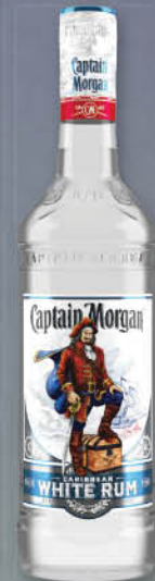
Rum beli Captain Morgan 1 l T.P.: 6 kos ŠIFRA art.: 324671