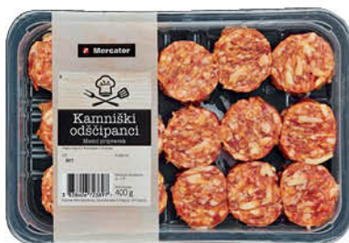
Odšcipanci Kamniški Minute, pakirani, 400 g ŠIFRA art.: 536492