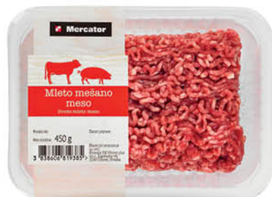
Mleto mešano meso Mercator, pakirano, 450 g ŠIFRA art.: 247878