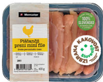
Piščančji mini file Mercator, Izbrana kakovost, pakiran, 400 g ŠIFRA art.: 237464