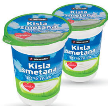
Kisla smetana Mercator, 20% m.m., 400 g T.P.: 12 kos ŠIFRA art.: 366029