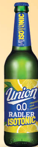
Pivo Radler Isotonic, brezalkoholno, 0,5 l, steklenica T.P.: 20 kos ŠIFRA art.: 870313