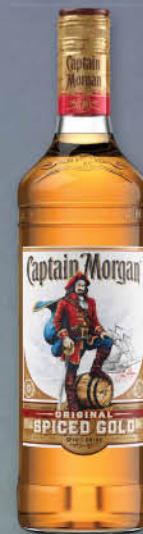
Rum Captain Morgan 1 l T.P.: 12 kos ŠIFRA art.: 157917