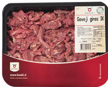
Goveji Gyros KA Košaki, 480 g ŠIFRA art.: 083831