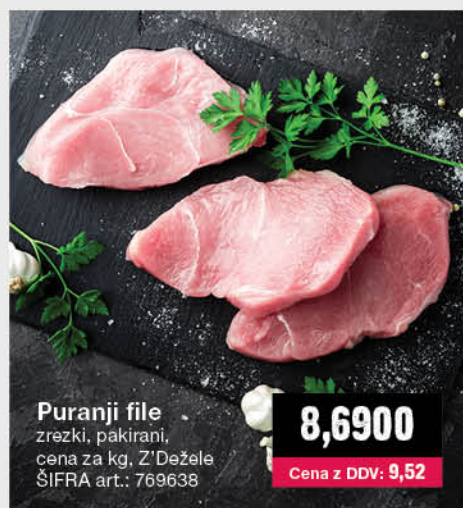
Puranji file zrezki, pakirani, cena za kg, Z'Đežela ŠIFRA art.: 769638