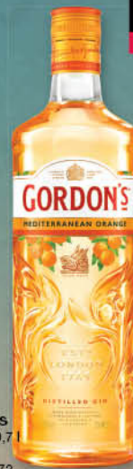
Gin Gordon's Mediterranean Orange, 0,7 l T.P.: 6 kos ŠIFRA art.: 518094