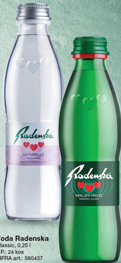
Voda Radenska Classic, 0,25 l T.P.: 24 kos ŠIFRA art.: 580437