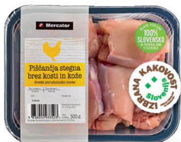
Piščančja stegna brez kože in kosti, Mercator, Izbrana kakovost, pakirana, 500 g ŠIFRA art.: 135972