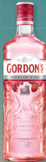
Gin Gordon's Pink, 0,7 l T.P.: 6 kos ŠIFRA art.: 603972