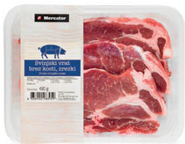
Svinjski vrat Mercator, brez kosti, pakiran, zrezki, 480 g ŠIFRA art.: 598282