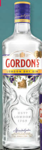
Gin Gordon's 1 l T.P.: 12 kos ŠIFRA art.: 166181