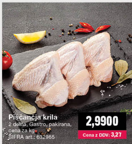
Piščančja krila 2 delna, Gastro, pakirana, cena za kg ŠIFRA art.: 632965