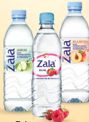
Zala več okusov, 0,5 l T.P.: 6 kos ŠIFRA art.: 201908, 479781, 689288