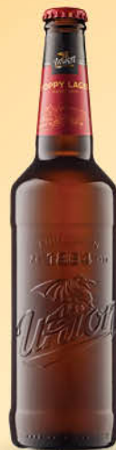
Union Premium Hoppy lager, 0,5 l T.P.: 20 kos ŠIFRA art.: 618430