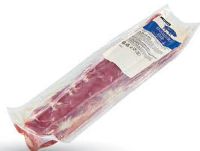
Svinjski file Mercator, pakirani, cena za kg ŠIFRA art.: 263257