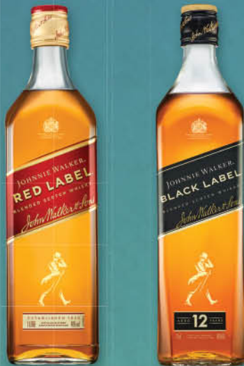
Whisky Johnnie Walker Red Label, 1 l T.P.: 12 kos ŠIFRA art.: 004760