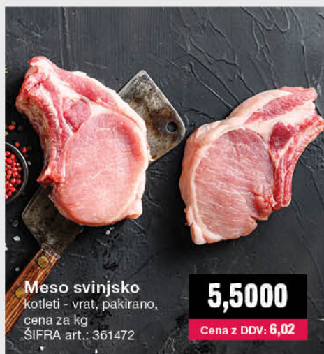
Meso svinjsko kotleti - vrat, pakirano, cena za kg ŠIFRA art.: 361472