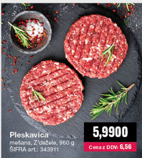
Pleskavica mešana, Z'đežela, 960 g ŠIFRA art.: 343911