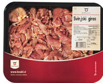
Svinjski Gyros KA Košaki, 480 g ŠIFRA art.: 083967