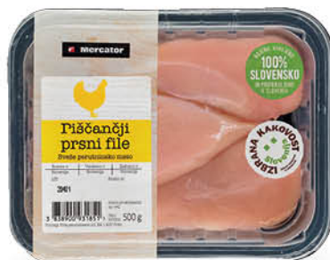
Piščančji file Mercator, Izbrana kakovost, pakiran, 500 g ŠIFRA art.: 134803