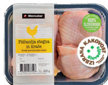
Piščančja stegna in krače Mercator, Izbrana kakovost, pakirana, 600 g ŠIFRA art.: 135985