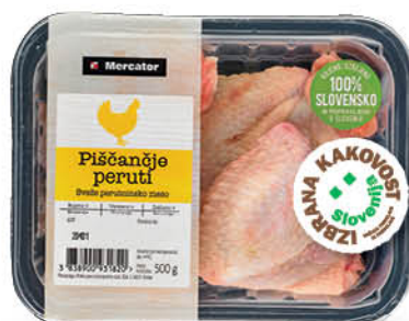
Piščančje peruti Mercator, Izbrana kakovost, pakirane, 500 g ŠIFRA art.: 134809